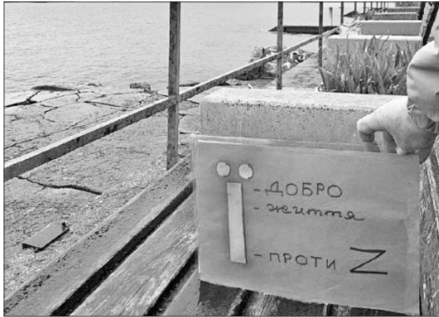
... а це варто взяти до уваги окупантам у Криму