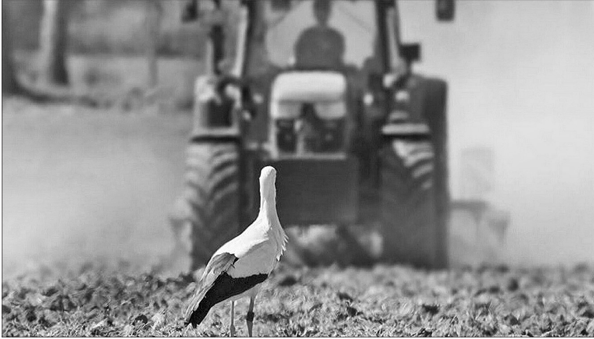
Лелек, які супроводжують селян під час оранки й сівби, вважають символами майбутнього врожаю

На 3 квітня хлібороби Полтавщини посіяли 17,7 тисячі гектарів