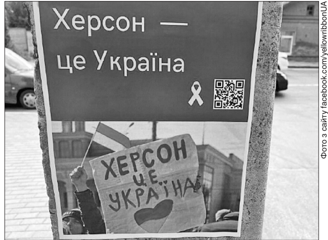
Такі листівки наближали звільнення Херсона...

Потужний опір москвитам триває і на окупованих територіях Запорізької та Херсонської областей. Південне місто Мелітополь, відоме врожайними добірної смачної черешні, після повномасштабного вторгнення рашістів, за версією закордонних експертів, визнано центром партизанського опору. Як жартома кажуть мелітопольці, тепер вони перейма-