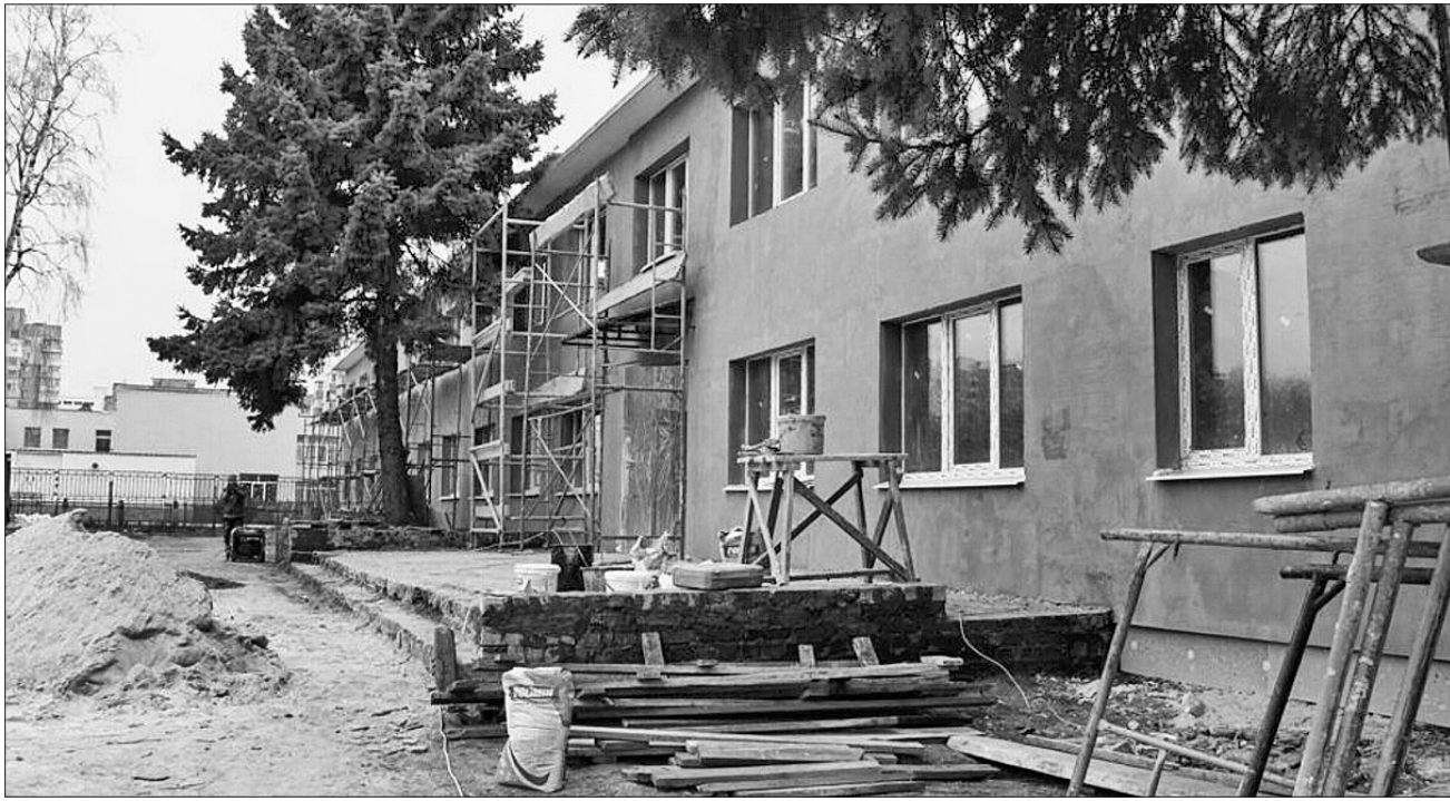
У приміщенні колишнього дитячого садка на вулиці Кобзарській у Черкасах планують облаштувати ще один тимчасовий притулок для 150 переселенців

На Черкащині чимало гарних починань для поліпшення житлових умов і налагодження нормального життя переселенців. Недавно привернула увагу ініціатива народного депутата України Андрія Стріхарського, яка стосується забезпечення внутрішньо переміщених осіб новим житлом. У місті Городищі він презентував проєкт ре-